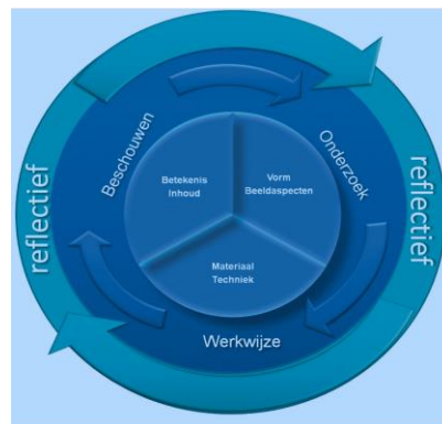
Figuur 1: Pabo kennisbasis bk&v

Hoe op basis van deze drie begrippen een concrete les kan worden ingericht wordt in het primair onderwijs uitgewerkt in de Kennisbases voor de pabo's. Dit is een cirkelmodel dat in de kern bestaat uit de productcomponenten betekenis , vorm en materie (figuur 1).